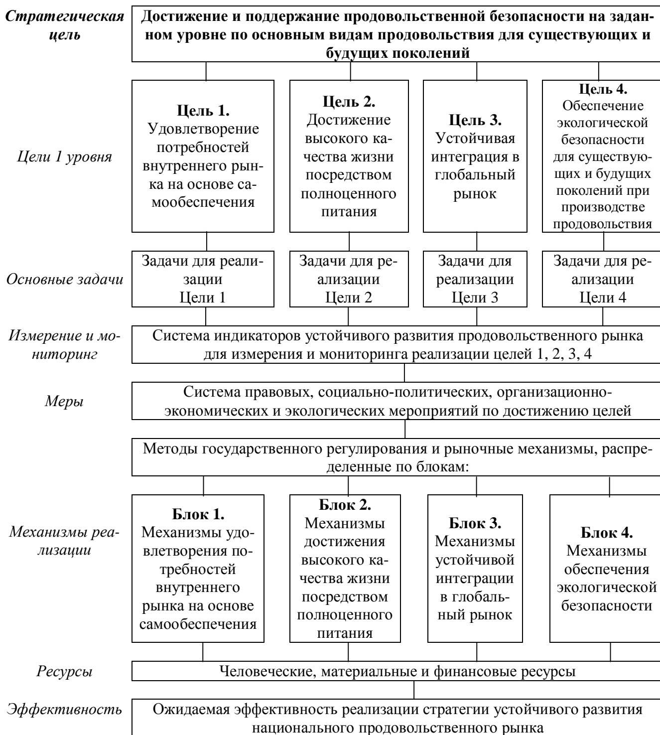
Рисунок 2. – Принципиальная схема устойчивого развития национального продовольственного рынка

Примечание – Предложено автором по материалам исследований.